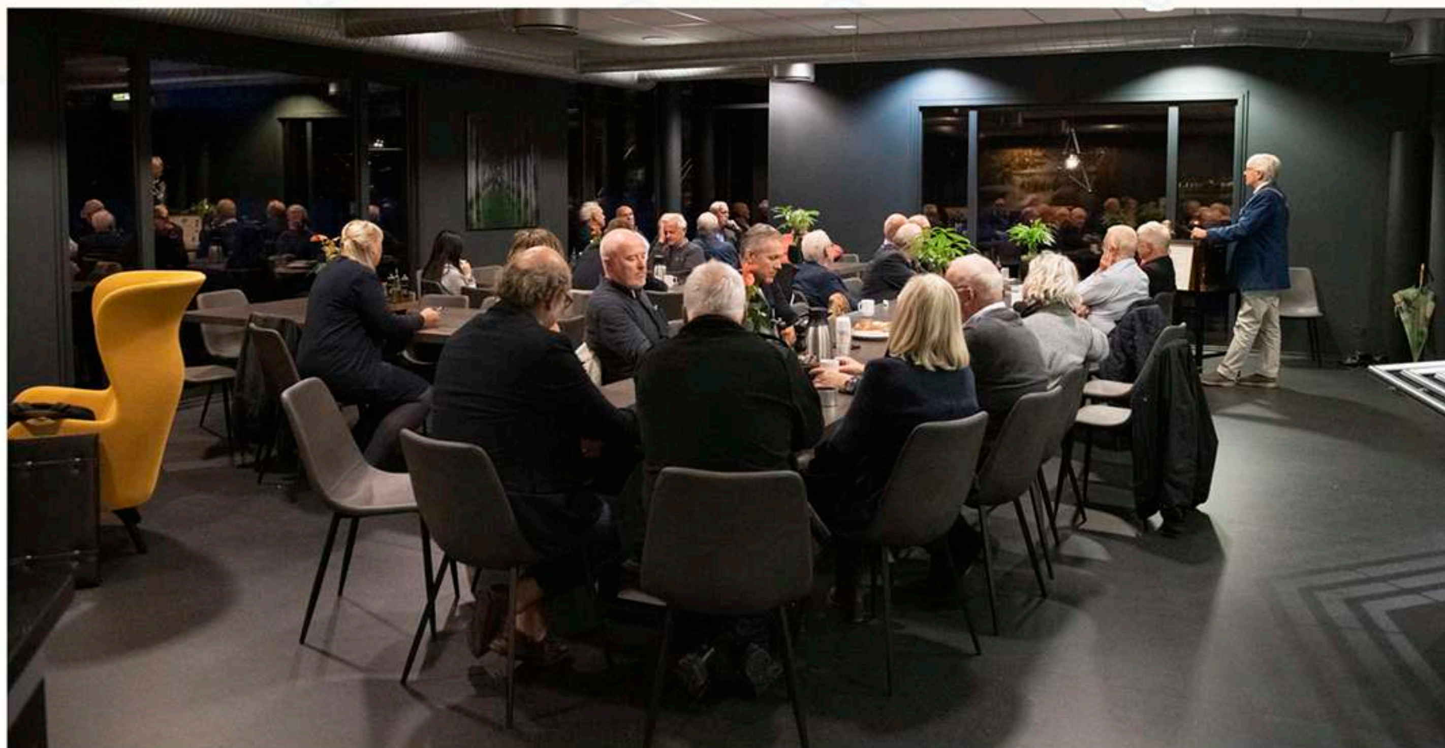
Møtelokalet per oktober 2019 er kantinen til iFokus, Elveveien, Larvik